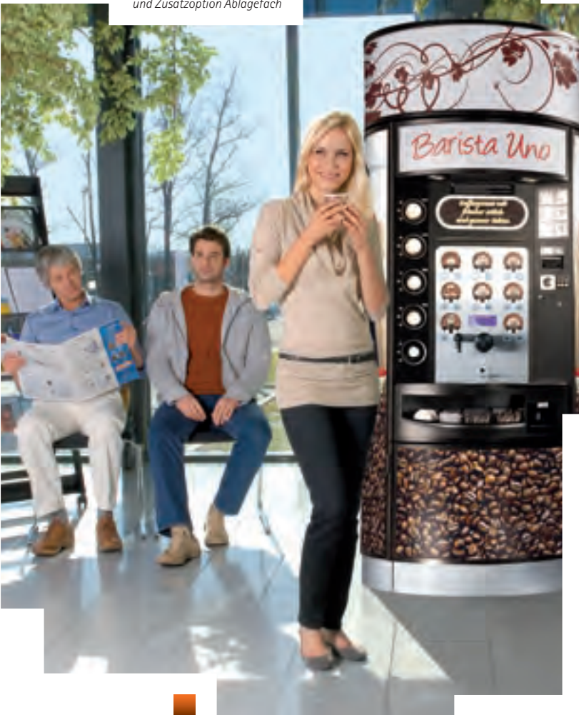
Barista Uno mit Werbeaufsatz und Zusatzoption Ablagefach