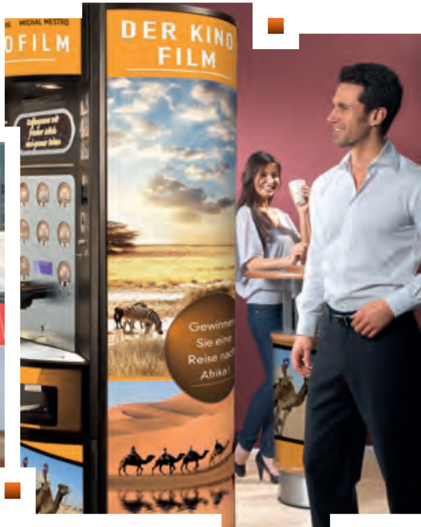
Barista Uno mit individuellem Branding