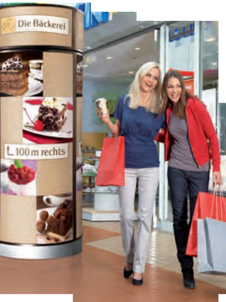
Barista Uno mit Werbeaufsatz, gewölbter Rückwand und individuellem Branding