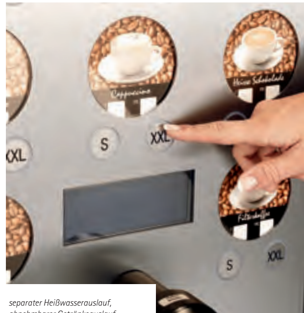
separater Heißwasserauslauf, abnehmbarer Getränkeauslauf